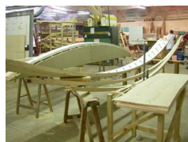
Fabrication des limons courbes sur gabarits en lamellé collé de sapin de pays